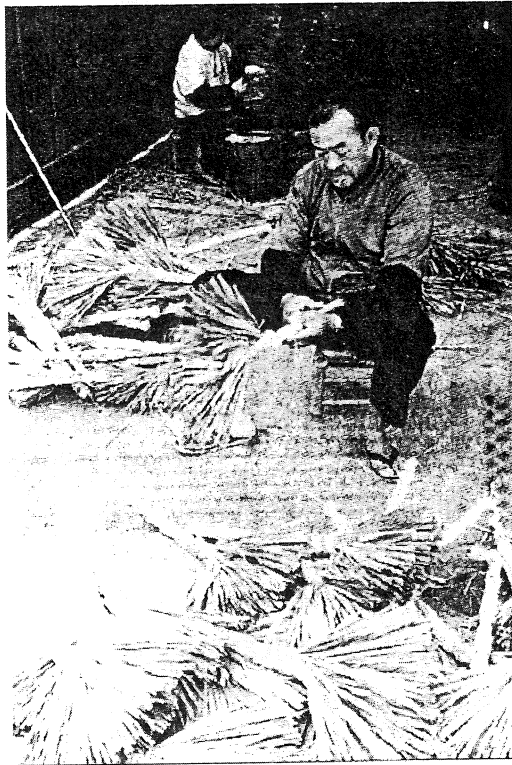
圖一 糠榔樹葉綁掃帚

綁掃帚是細細的葉子外圍包住竹桿，而師父能把糠榔樹葉子折成斜型的手工藝術，而在掃帚外圍用細鐵絲綁約五個結加以固定之後，再用剪刀修整葉子，才算完成步驟井然有序的糠榔樹，是昔日綁掃帚的原料，但迄今依然屹立。雖然經濟不景氣，而綁掃帚的利潤並不多，但夫妻同心協力還足以餬口。