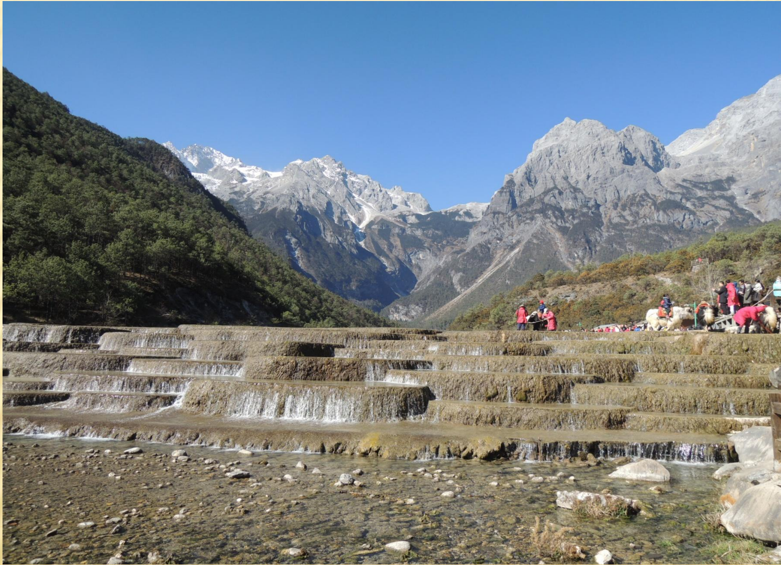
圖9a：由白水台遠眺玉龍雪山，近處有遊客騎犛牛