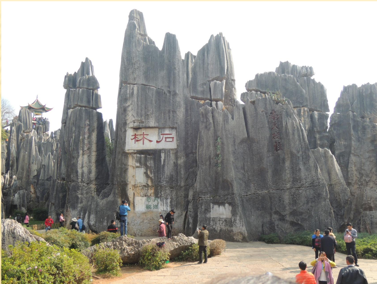
圖5：雲南昆明的地標—石林