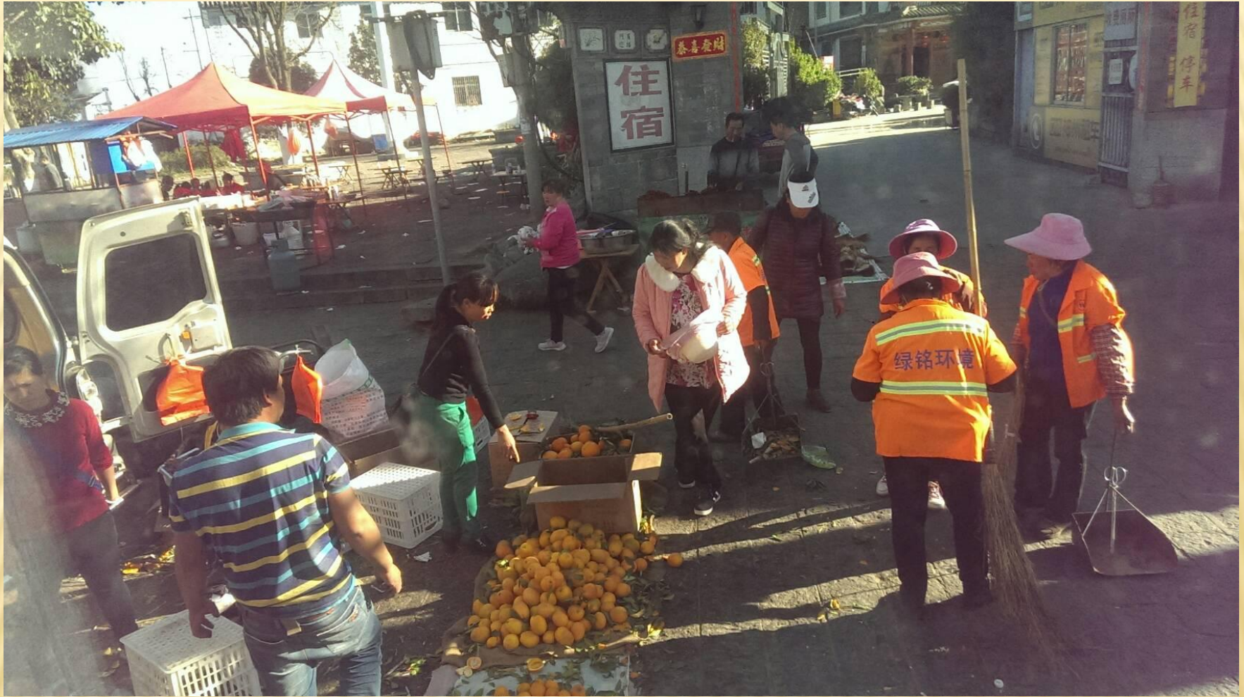
圖10：雲南好吃的橙子，個頭不大，汁多味甜。