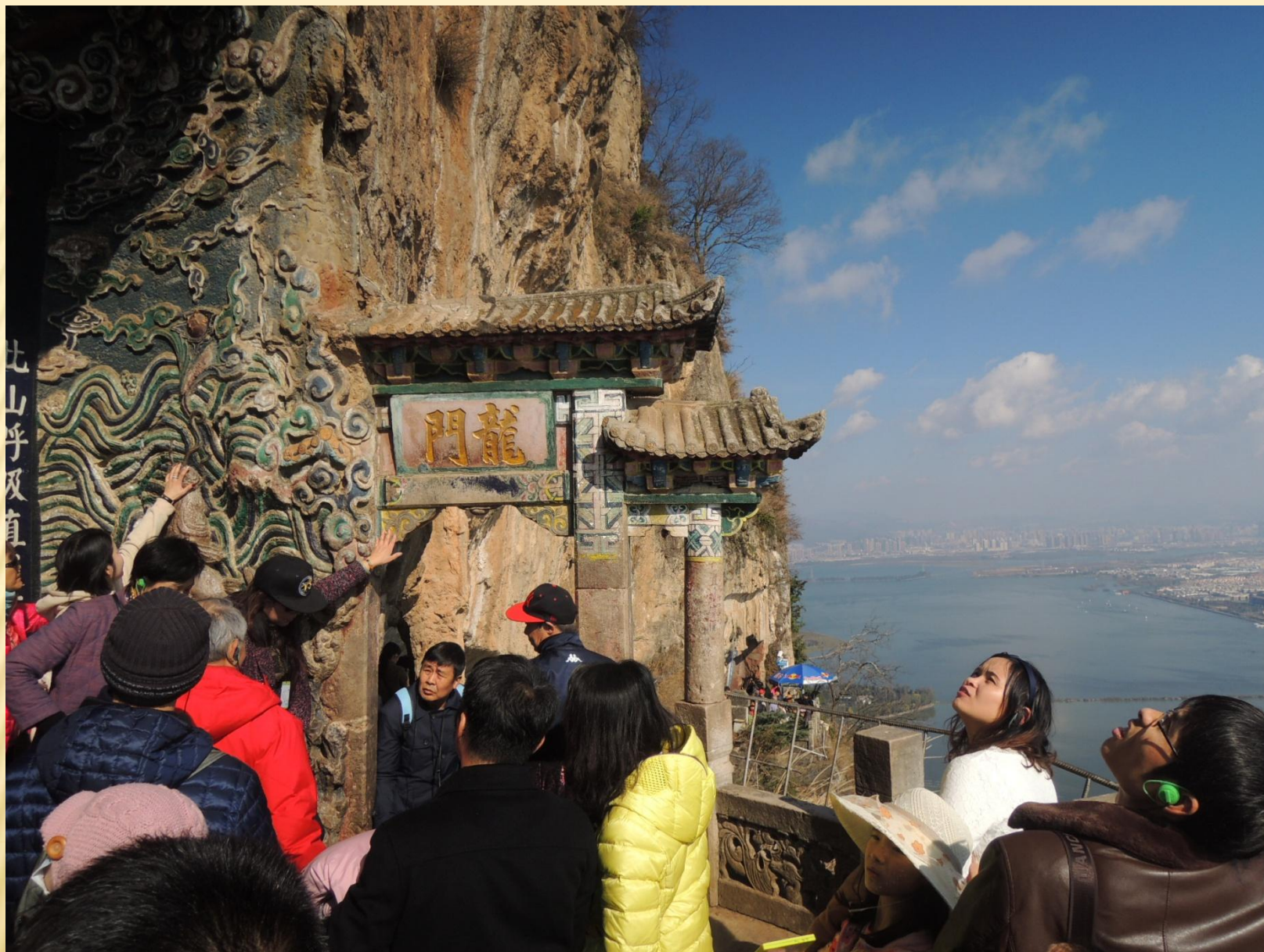
圖2：大家都要摸龍門，祈求好運氣。