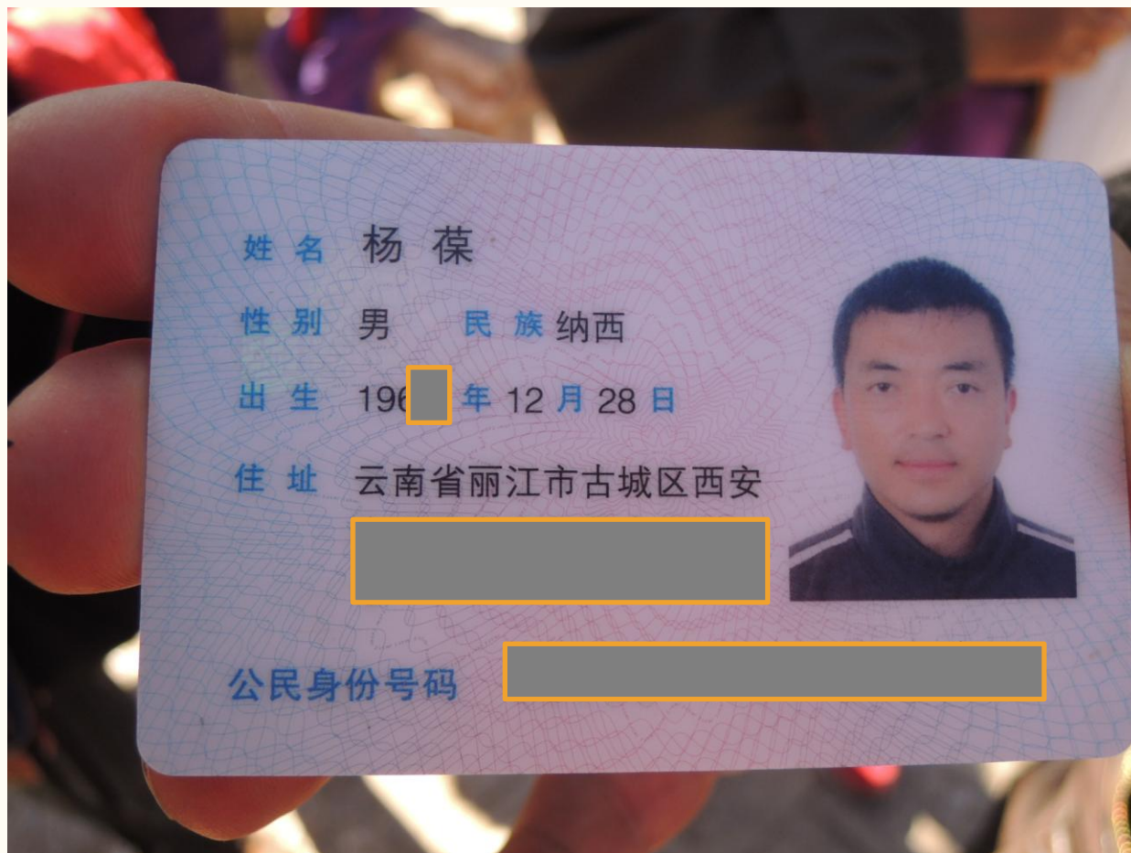
圖 16： 納 西 族 的 身 分 證