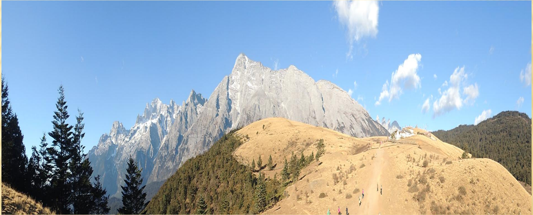
圖4：180度玉龍雪山的美景