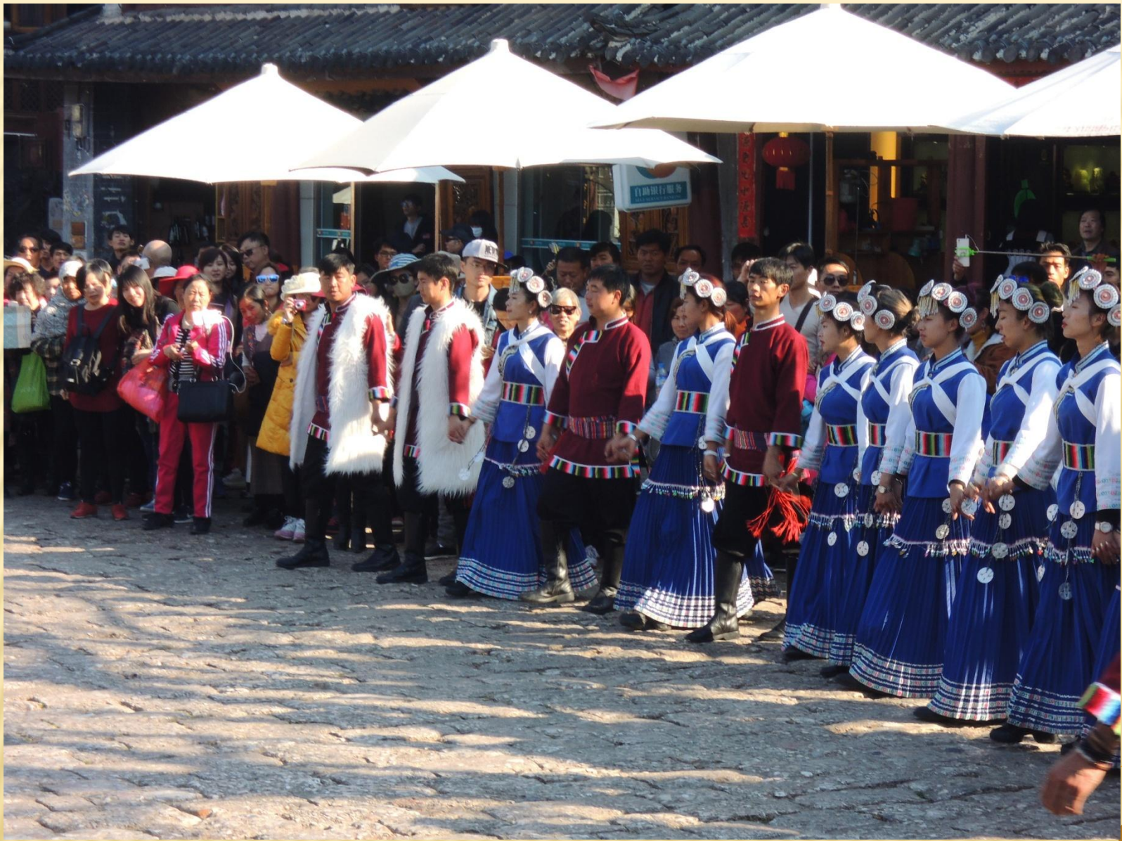
圖7：納西族歌舞表演，與台灣與原住民舞蹈差不多，邀觀眾一起跳舞