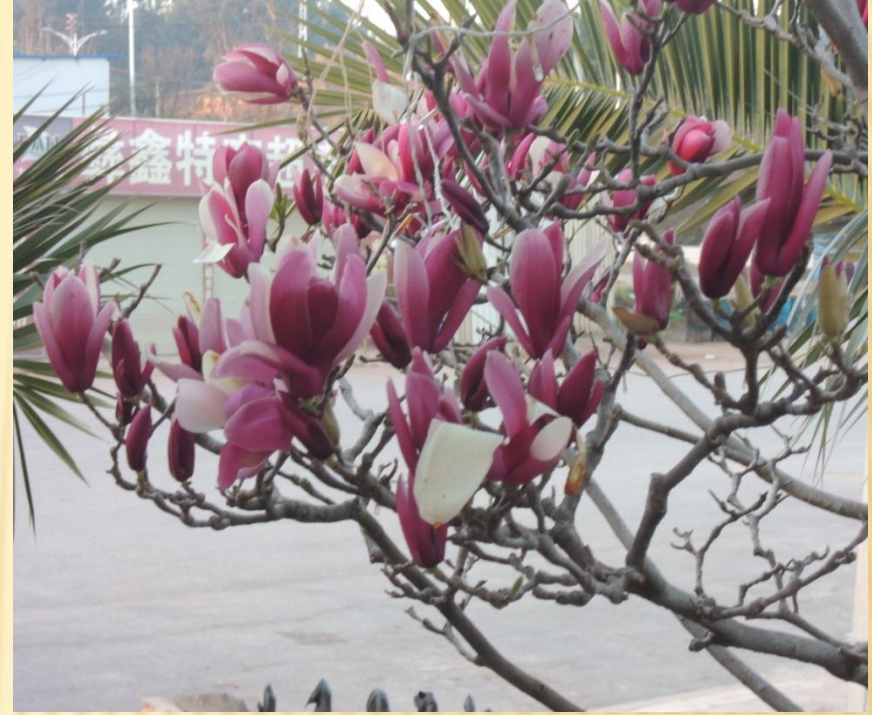
圖11：左圖為雲南常見的行道樹—假黃花槐， 右圖為木蘭(辛夷)。