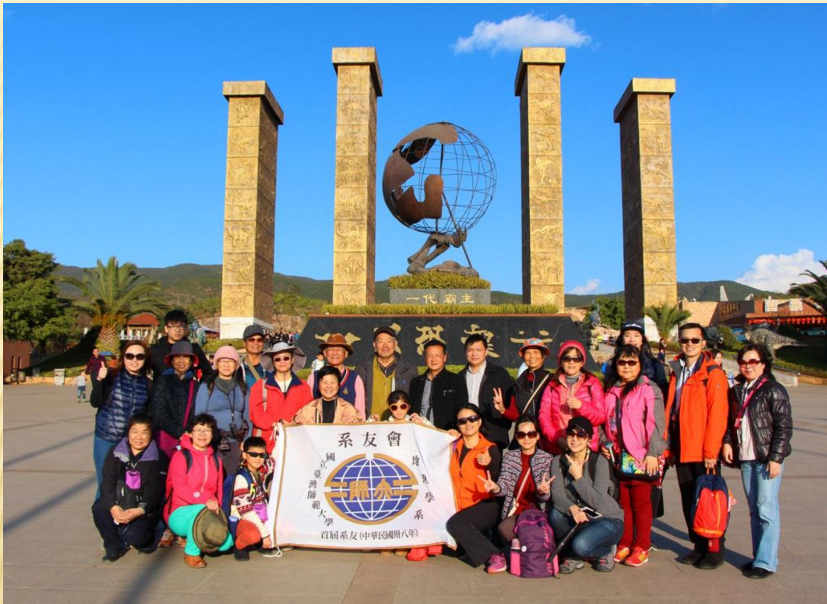
圖18：全體團員與四位恐龍專家(後排中央)合影。