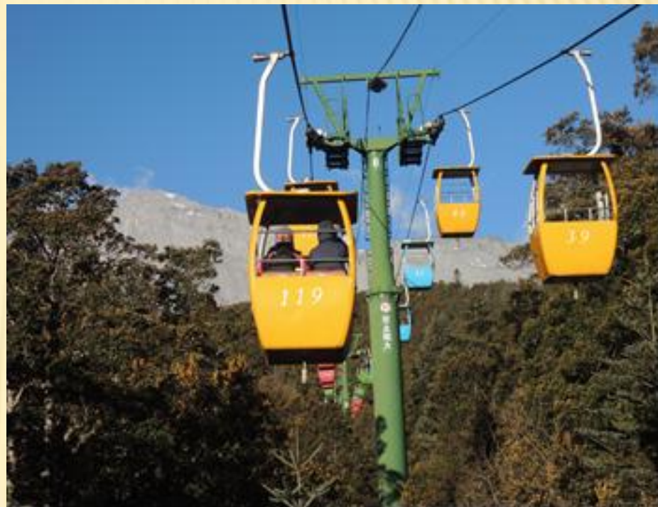
圖1：左圖昆明西山龍門簡易的纜車；山下是美麗的滇池；右圖是登玉龍雪山的纜車