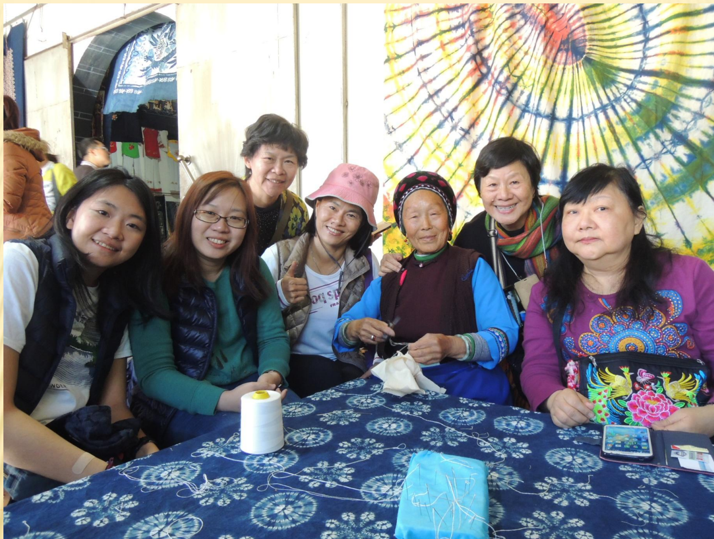
圖15：認真的白族老太太，拍照仍不忘工作。