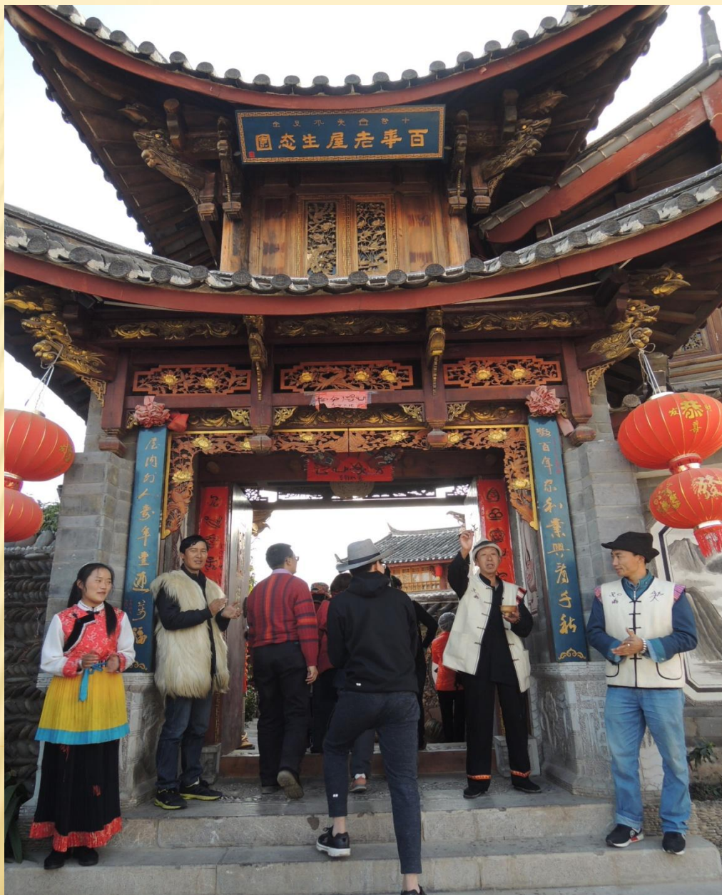
圖17： 納西老屋 的主人和 先生，熱 情接待我 們，與家 人，在門 口唱歌歡 迎我們的 到來