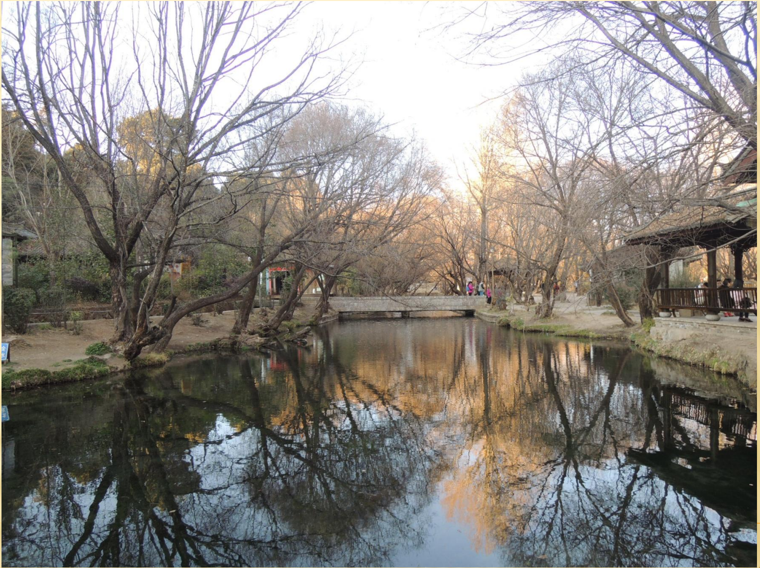
圖8：束水古鎮是茶馬古道的重鎮