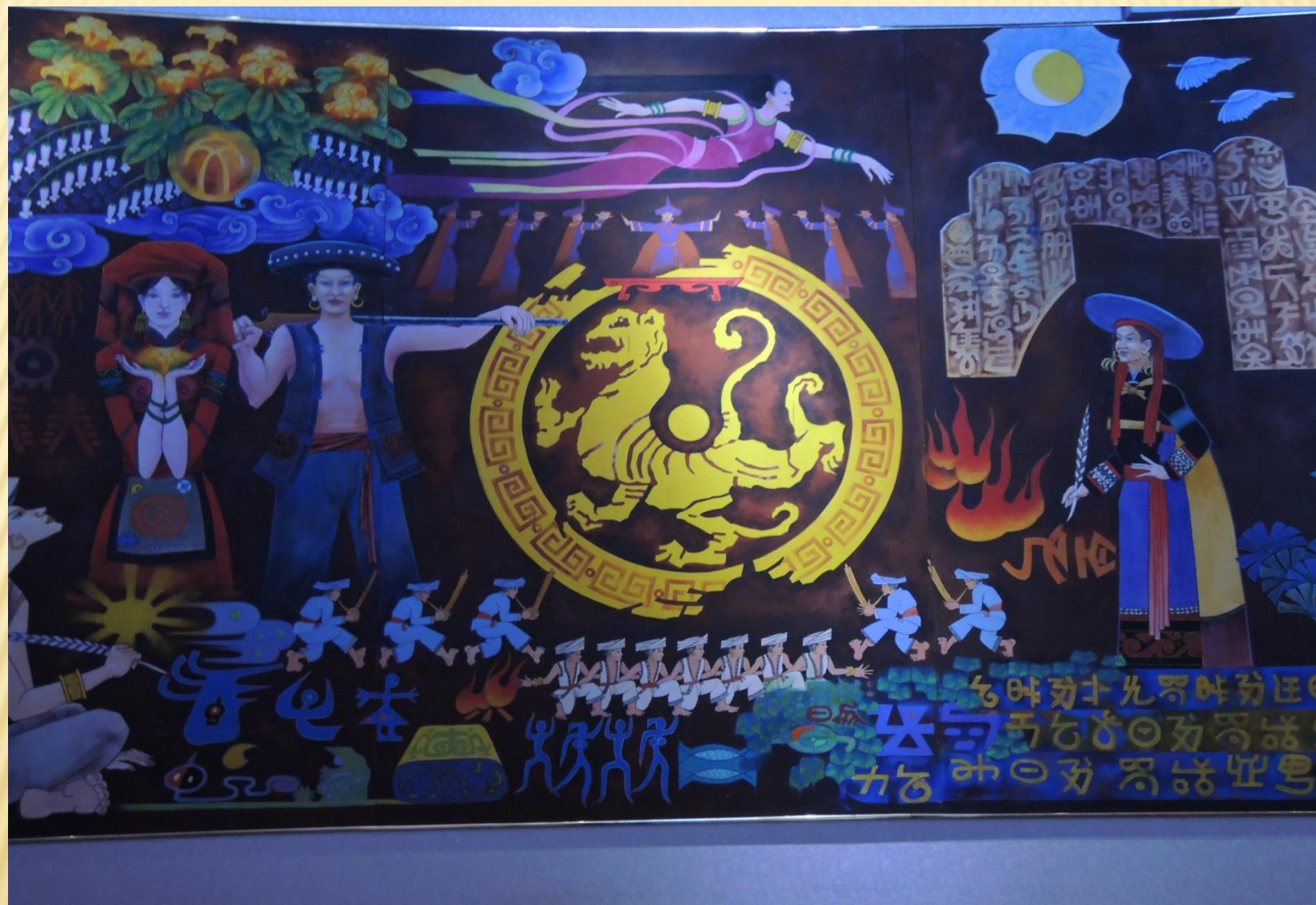
圖14：彝族是崇尚火、老虎的民族