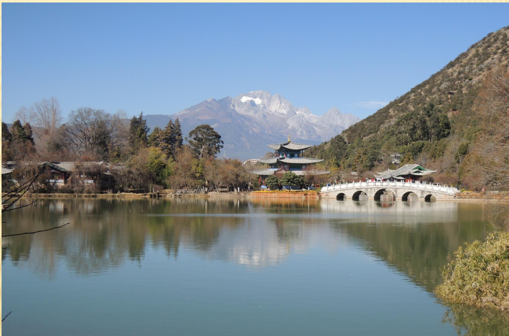
圖6：黑龍潭(玉泉公園)近山為象山，遠方白色的山則是玉龍雪山。