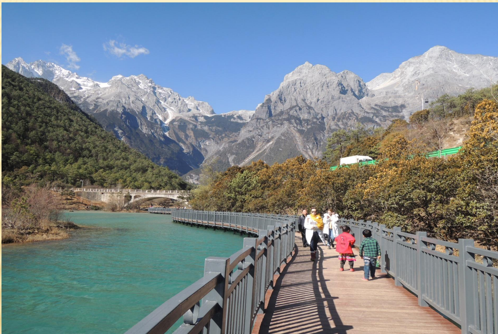
圖9b：由白水台遠眺玉龍雪山