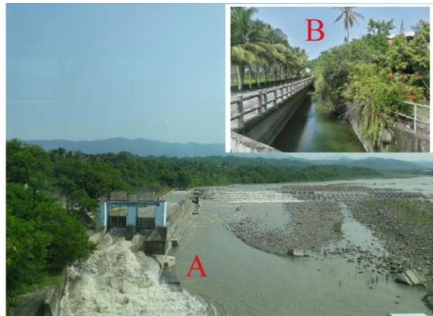
觀察楠梓仙溪越域引水到二仁溪的引水口及 導水圳線 B A