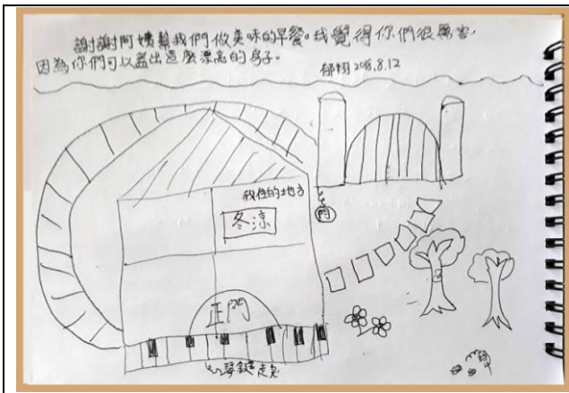
86 級黃彥鳴老師的愛女黃郁翔稱讚謝宜蓉叔叔及郭秋美嬤嬤兩人用了 18 年蓋出這麼漂亮的恬美農場，畫了上面的圖。(航照圖如右)

或 檔案: http://alumni.geo.ntnu.edu.tw/files/archive/251_4a7f5c38.pdf