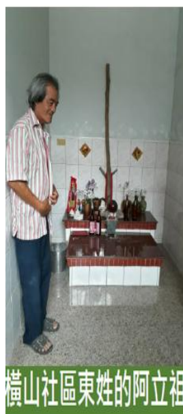
橫山社區東姓的阿立祖

東姓阿立祖放在房子龍側的小房間， 有一支通天柱，主人熱情的和系友 分享阿立祖賜給他的神蹟，並與系 友合照留念