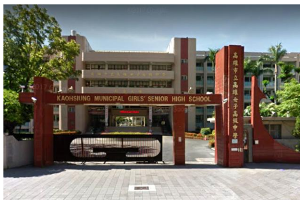
莊敬溫馨的高雄女子高級中學大門

( 引自鄭秀蘭系友專訪： http://alumni.geo.ntnu.edu.tw/news6/news.php?Sn=315 )