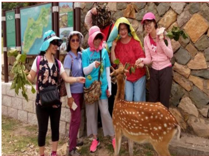
大坵島上的梅花鹿