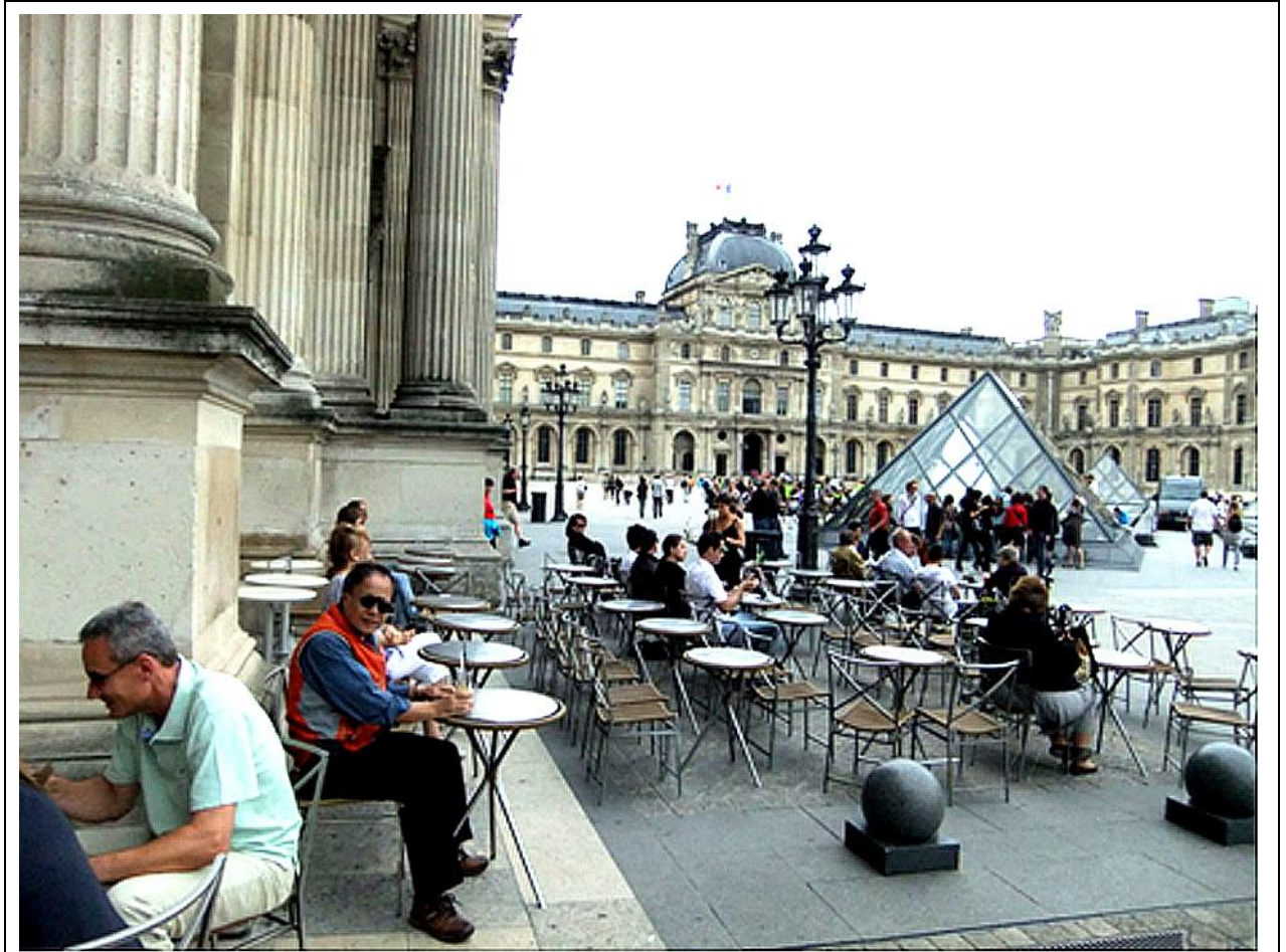
圖 3 自助旅遊法國瑞士，在巴黎的羅浮宮外。〔左二〕

在人生旅程中，能有機會同時欣賞美醜兩端風景，該是人生不錯的體驗。不然也可以開車或租車，悠閒地漫遊加州海岸公路，從灣區聖荷西到洛杉磯，這一段路可慢慢品嚐的景點不少。例如：雷根總統住過的小城 Santa Babara 的整齊小街道與漂亮洋房，可緬懷失智的雷根由夫人南西，舉起無力的手掌與街旁修剪花樹的老人打招呼的情景。逛完 Santa Babara,再到不遠的靠海小鎮 Carmel，選一個岸邊咖啡座喝喝咖啡小歇一下，也是很愜意的。好萊塢巨星克林伊斯威特曾當過 Carmel 市長，因而 Carmel 名氣跟著飛漲，到這裡朝聖的觀光客很多，你的咖啡店鄰桌，說不定就坐著兩三個追星族！