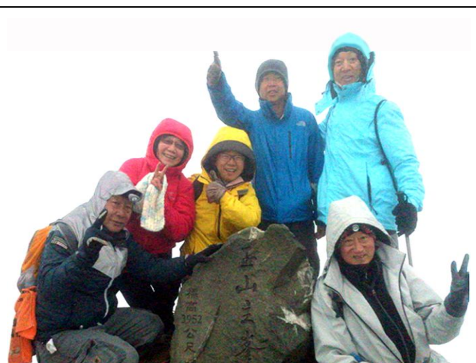
圖 6 二度攻頂玉山(前最左)， 於 2015 年 4 月 29 日

都說人生無非酸甜苦辣，我說爬山也是酸甜苦辣，五味雜陳。爬山過程中，當你覺得很累很累的時候，你有一絲絲的後悔油然而生，會問自己，我幹嘛要到這裡受苦？！但你與生俱來的恆心毅力意念，也會跟隨而來，因而你每次都能克服了痛苦而堅忍不拔地登上目標山頂。這個過程，當然是既酸又苦又辣；可是當你登到山頂，完成這一趟辛苦行，心中就有成就感，加上山頂可極目遠眺，風光明媚，內心自然就甜蜜蜜的。所以，每次在山路上都發誓「以後不要再像這樣爬山了」，可是下一次，無數個下一次，你仍會毫不遲疑地說「我要參加」。人就是這樣，在某一個角度看，這種反覆，刻意忽略曾經有過的痛苦心態，似乎很賤；但從另一角度來看，痛苦為成功之母，累積了許多痛苦之後，你人生的成績就向前推進了，創造力也跟著增強了。人類各式各樣文明，不就是這樣創造的嗎？