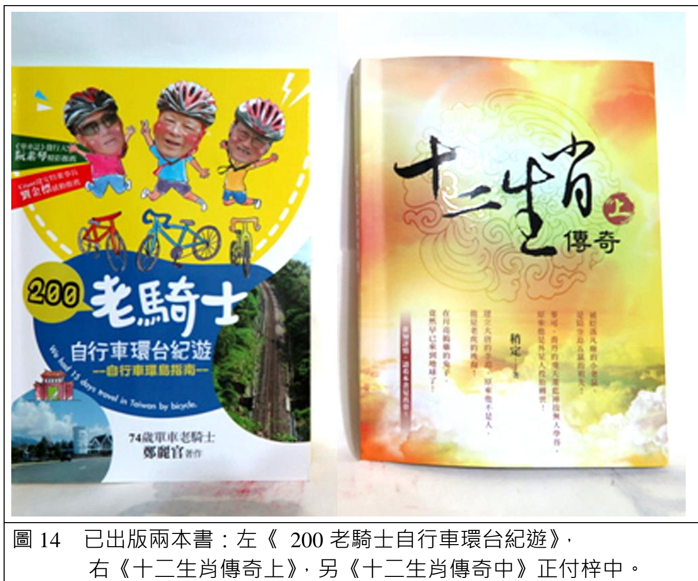
圖 14 已出版兩本書：左《200老騎士自行車環台紀遊》，右《十二生肖傳奇上》，另《十二生肖傳奇中》正付梓中。

身，加上在花蓮海岸撿到的白兔鵝卵石，讓我常想像牠們是十二生肖中的動物，引起我寫十二生肖故事的構想。《十二生肖傳奇》