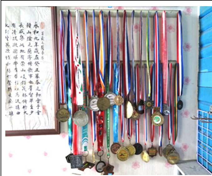
圖 9 全馬.半馬賽跑回終點獎。