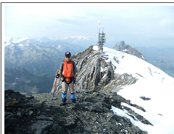
圖 5 登上瑞士鐵力士 Titlis 山頂