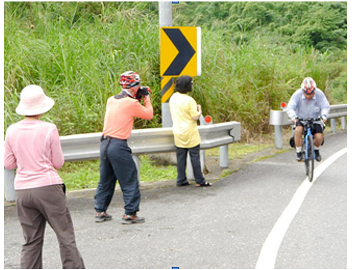
圖 10 自行車環島途中，騎上最難的玉長隧道口。