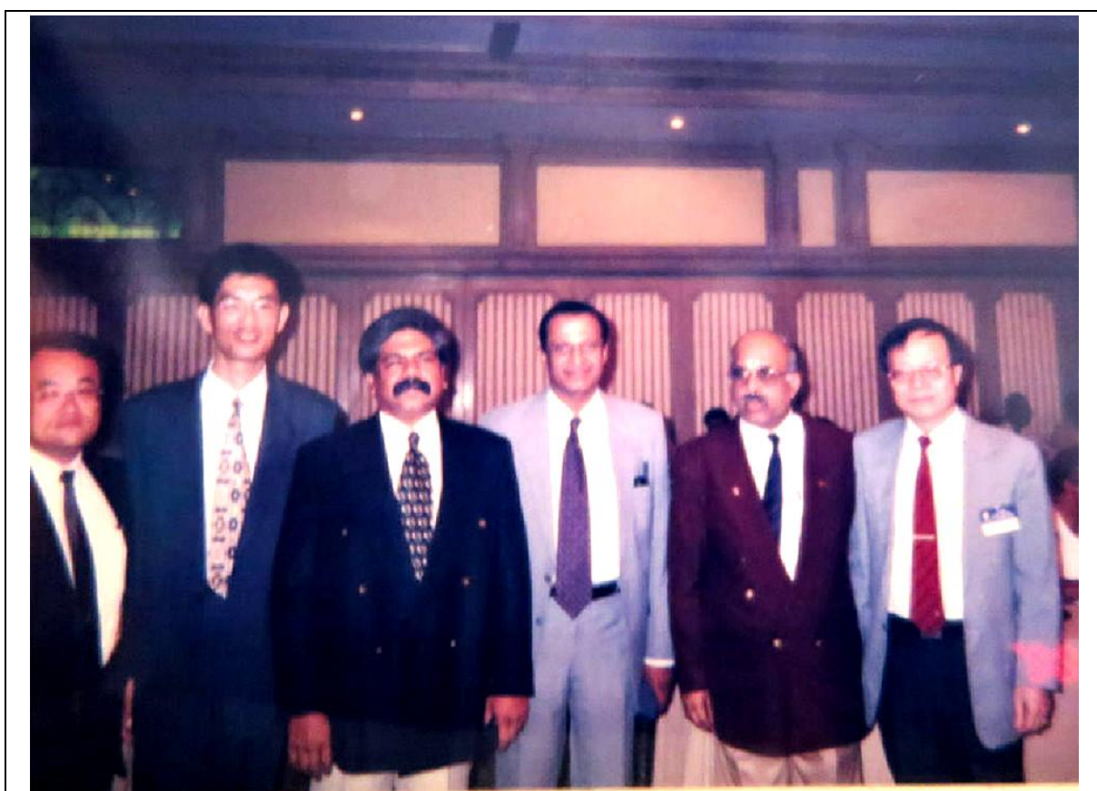
圖 2 參加孟買台灣產品展覽，代表台灣廠商發表談話後與印度主辦人員合影。〔右一〕

展鴻圖的生涯。然而，始料未及的種種羈絆，仍導致數年後因業務欠佳而結束營運。所幸 1994 年，輾轉進入高雄岡山豪星機電公司，主掌外銷業務直至退休。回顧多年來，尤其自 1980 年代至 2007 年間，因頻繁到世界各地推銷產品、拜訪客戶、接洽訂單、售後服務及參加展覽等，累積了多層次的國際貿易經驗，對於商貿、商展與外商談判，大都能得心應手，與客戶建立良好夥伴關係，因而留下深刻美好的互動經驗。