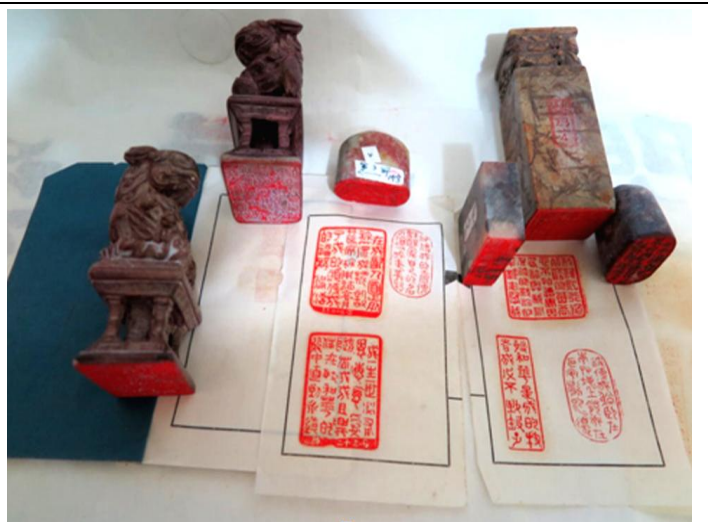
圖 13 印譜與印章

我喜歡運動，也喜歡靜態的刻印及書法，似乎是出自於天性；在學習書法的同時，就想嘗試刻製與書法相伴襯的印章。有些印章是大型的(大都是 45X45mm)，例如我寫了一幅柳宗元的江雪：