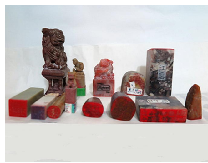
圖 12 所列為自刻印章成品中較大型者。

術品的讚賞，這很像近年網路上對他人意見按個「讚」的味道。但這不是普通人可以做的，只有頂尖文人、學問家，這樣做才不會挨罵。中國的皇帝特別是明清兩代的皇帝，喜歡在別人的名畫上蓋自己的章，以示自己文雅不是土包子。傳言乾隆皇帝有御用印章師，為他雕刻專屬印章數百；所以我們常會發現古代名畫上，有乾隆皇的御印，有時同一幅畫上，還不止一顆印章呢！（圖 12 及 13）