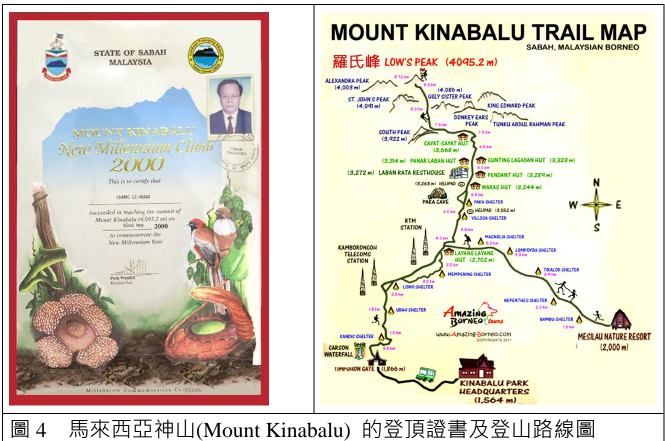
圖 4 馬來西亞神山(Mount Kinabalu) 的登頂證書及登山路線圖

鄭：什麼里龍山( 屏東，小百岳之一，海拔 1,069m )、大棟山 (嘉義，1,976m)、七星山、大屯諸峰、觀音山、筆架山...等 等都算是小 case。台灣百岳我爬過 27 座，大陸五嶽我也一一 登頂過，甚至日本第一高峰富士山( 主峰名：劍峰， 3,776m，我在 2008 年 7 月 11 日與楊江淮夫婦一起登臨 )， 而東南亞最高峰馬來西亞的神山(Mount Kinabalu, 4,095.2m， 我在千禧年和豪星副廠長吳進成趁公司到沙巴旅遊之便，一 一起上神山 )。(圖 4) 瑞士鐵力士山( Gross Titlis，3,238m， 旁邊還有小鐵力士山，3,020m，是觀景台所在地；我從觀景 台起步，跟隨嚮導踩著厚厚積雪，留下深深的腳印，一步步 往上爬，僅 40 分鐘就爬到山頂，十分輕鬆 )。