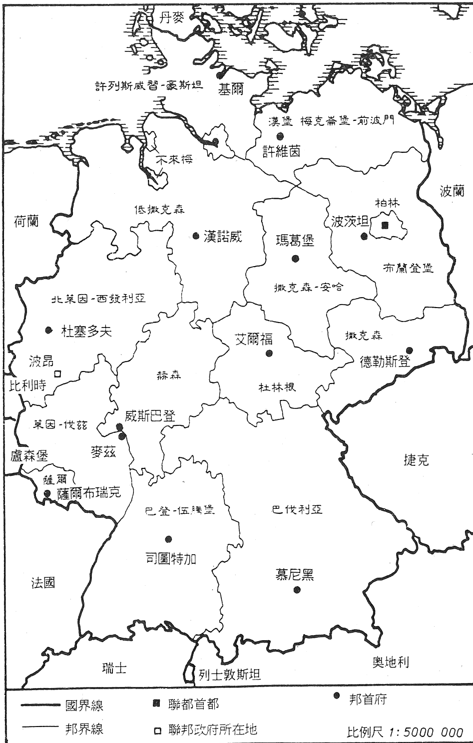
圖 1 德國聯邦共和國行政區劃圖 (1990 年 10 月 3 日以後)