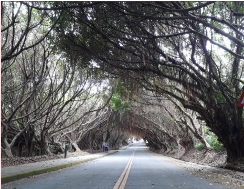
圖5 有容路的林蔭步道