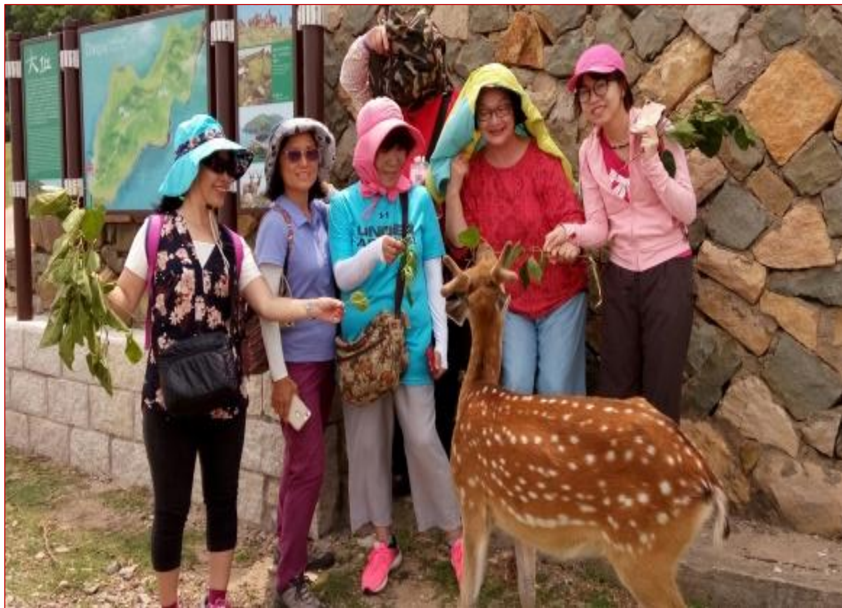
圖9 大坵島上的梅花鹿