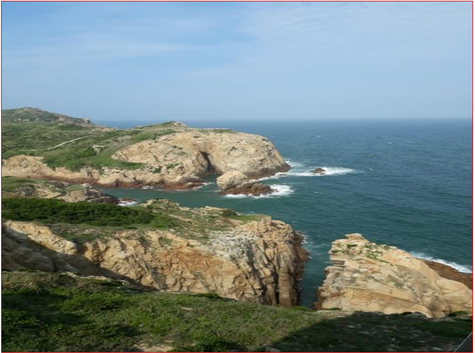
圖2 東莒島的神祕小海灣