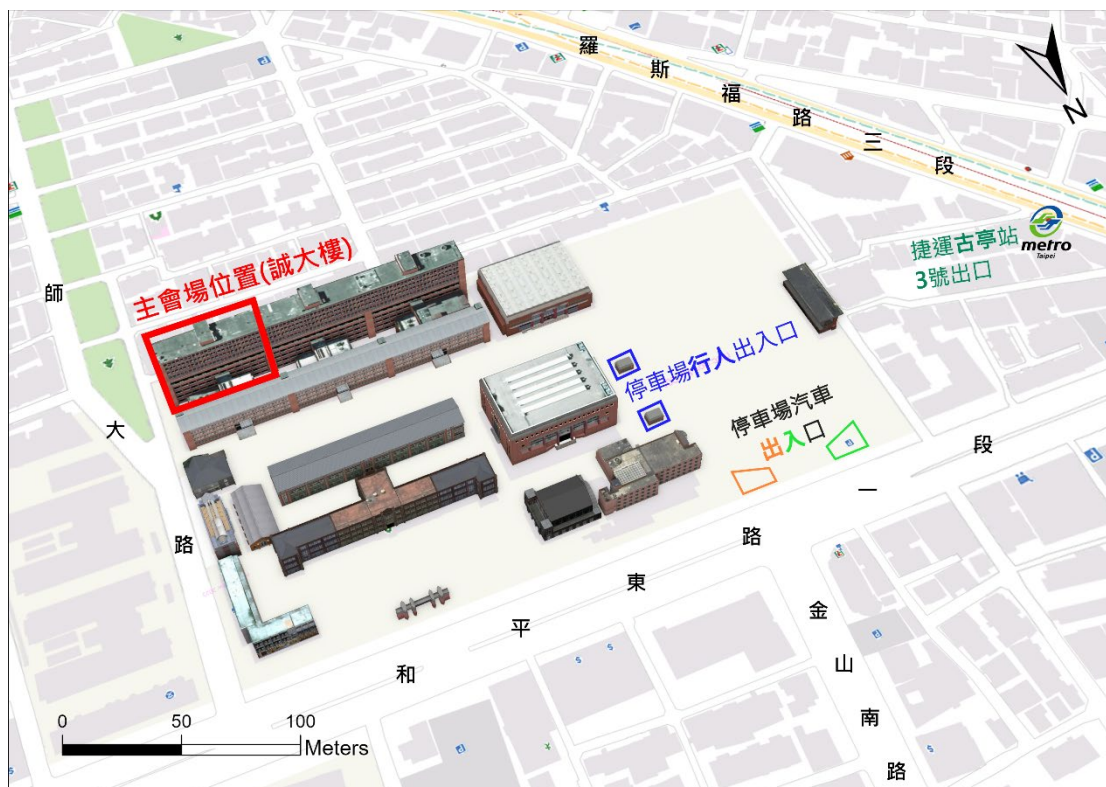
研討會位置圖：臺北市大安區和平東路一段 162 號，臺灣師大和平校區 I 誠正大樓